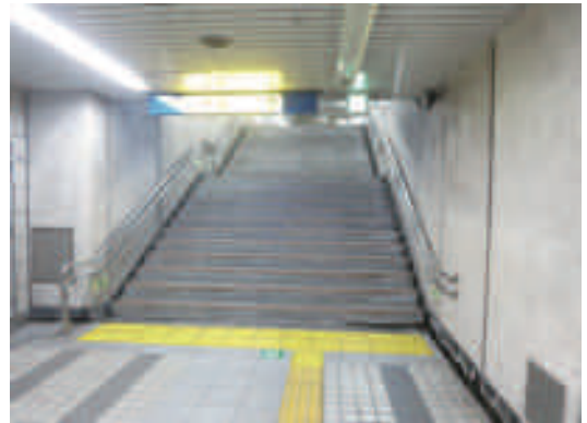
①Turn left from the ticket gate and go up the stairs 改札を出て左へ曲がる